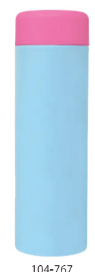
104-767 P K×B L

氷止め付きの飲み口が付いた、使いやすいボトル。用途によりボディカラーを選べます。