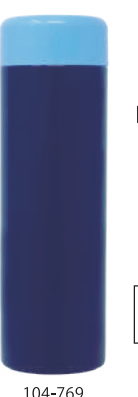
104-769 B L×N V

■ポケミニボトル NEW 【容量】180ml 【材質】本体:ステンレス鋼 蓋:ポリプロピレン パッキン:シリコーン 【現品サイズ】φ45×H169mm 128g