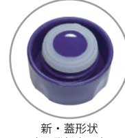
新・蓋形状 <意匠登録出願中>