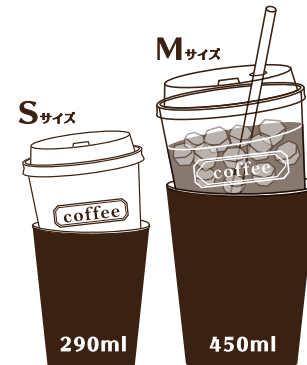
<ドリンクホルダー使用例>

※カップのサイズによっては、うまく使用できない場合がございます。予めご了承ください。